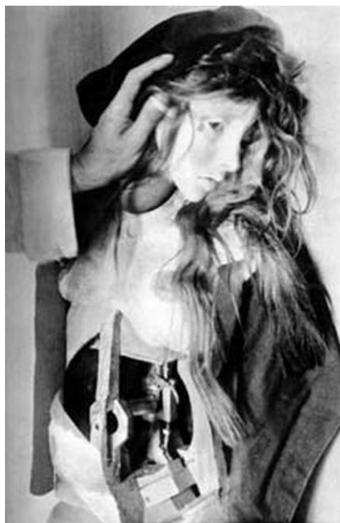
【圖 6】 Hans Bellmer, Die Puppe , 1934