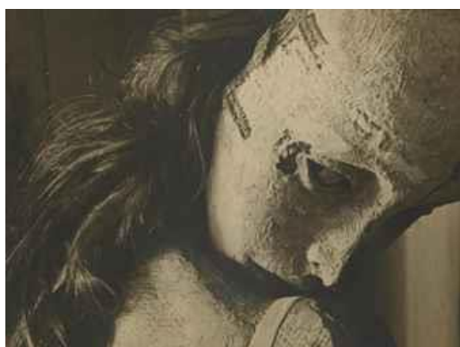
【圖 4】 Hans Bellmer, Die Puppe , Detail, 1934