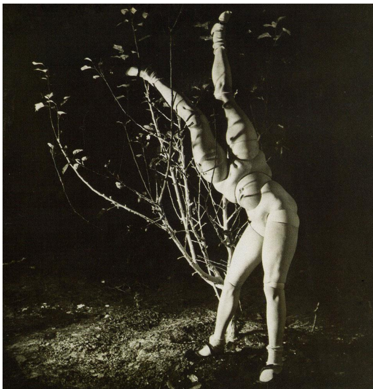
【圖 12】 Hans Bellmer, La Poupée (maquette pour Les jeux de la Poupée ), 1938