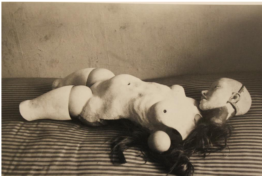
【圖 7】 Hans Bellmer, Die Puppe , 1934