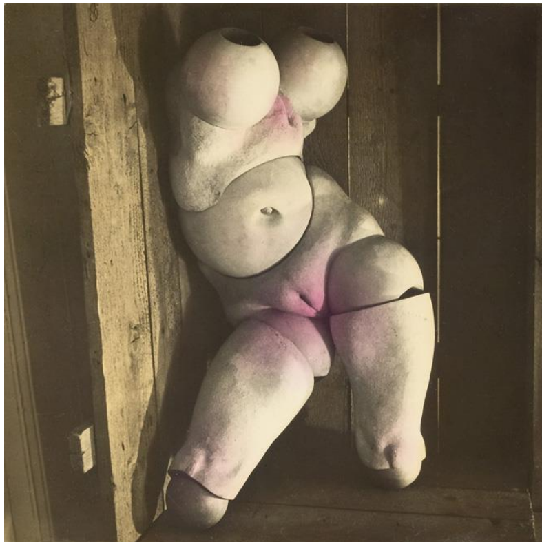
【圖 9】 Hans Bellmer, La Poupée , 1935