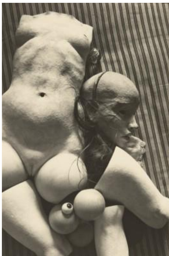
【圖 1】 Hans Bellmer, Die Puppe , 1934