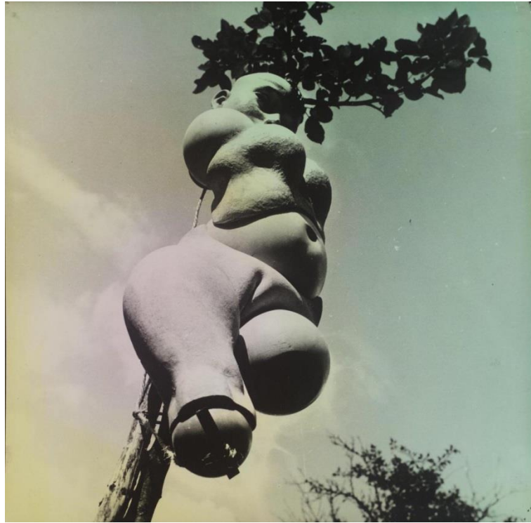
【圖 8】 Hans Bellmer, Die Puppe , 1934