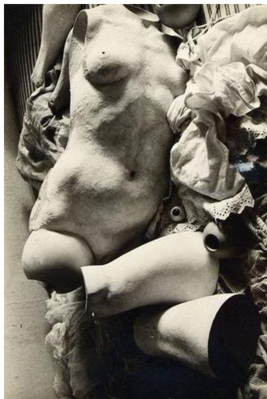
【圖 2】 Hans Bellmer, Die Puppe , 1934