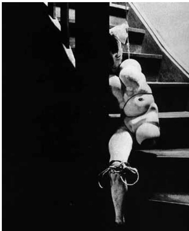
【圖 10】 Hans Bellmer, Die Puppe , 1934