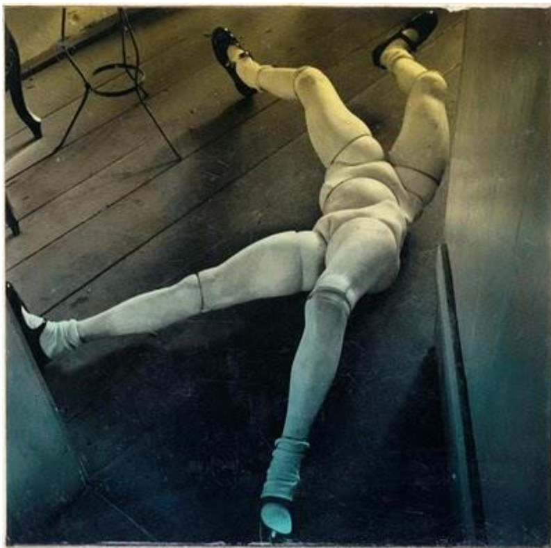
【圖 14】 Hans Bellmer, La Poupée (maquette pour Les jeux de la Poupée ), 1938