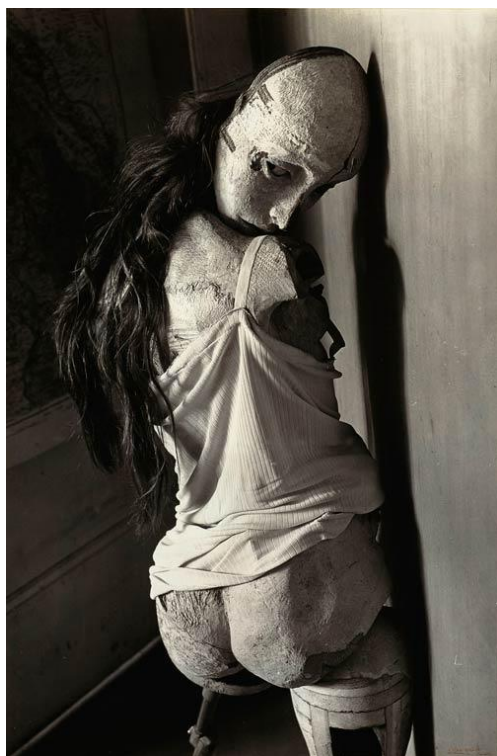
【圖 3】 Hans Bellmer, Die Puppe , 1934