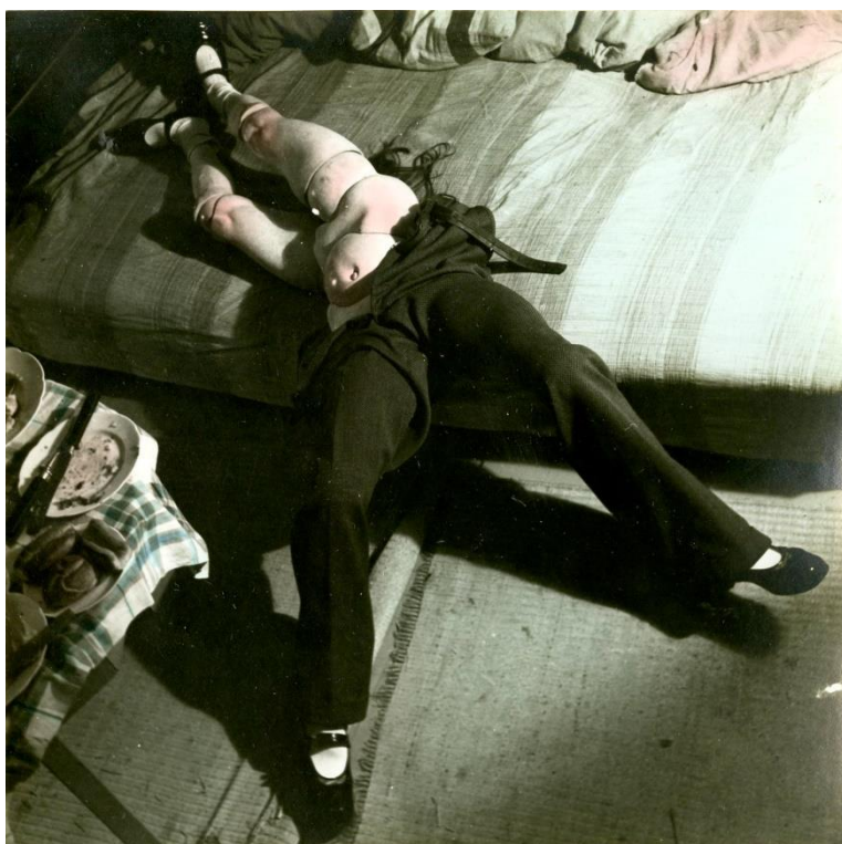
【圖 13】 Hans Bellmer, La Poupée (maquette pour Les jeux de la Poupée ), 1938