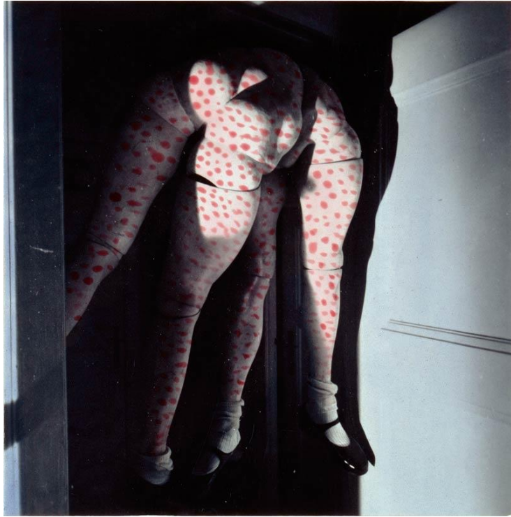
【圖 16】 Hans Bellmer, La Poupée (maquette pour Les jeux de la Poupée ), 1938