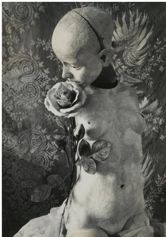
【圖 5】 Hans Bellmer, Die Puppe , 1934